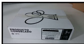
Caja master (325X255X95)