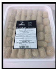
Bandeja Kg. Formato Croqueta